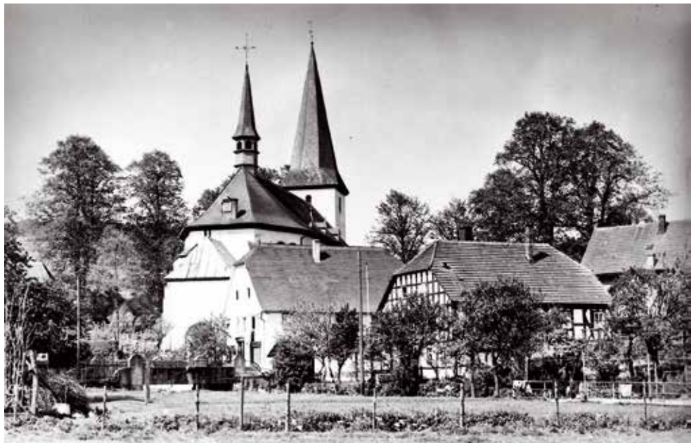
Eslohe um 1900

Zu Beginn des 19. Jahrhunderts wurde auch in Eslohe ein Armenfonds gegründet, da für die Armenfürsorge vor Ort von ehrbaren Bürgern Spenden geleistet, Stiftungen begründet und Schenkungen aus „wohltätigen Testamenten“ erfolgten. Diese wurden von der Kirche beaufsichtigt und dem Fonds zugeführt, verwaltet von einem Armenvorstand. Der mehrköpfige Vorstand und der Pfarrer als Präses entschieden über die zweckgebundene Verwendung des Vermögens; das aber alles unter der Aufsicht der preußischen Obrigkeit.