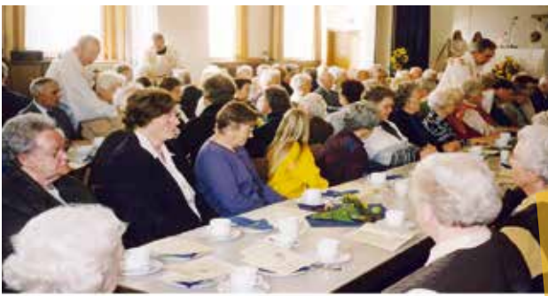
Krankensalbung im Pfarrheim am 9. Oktober 2002