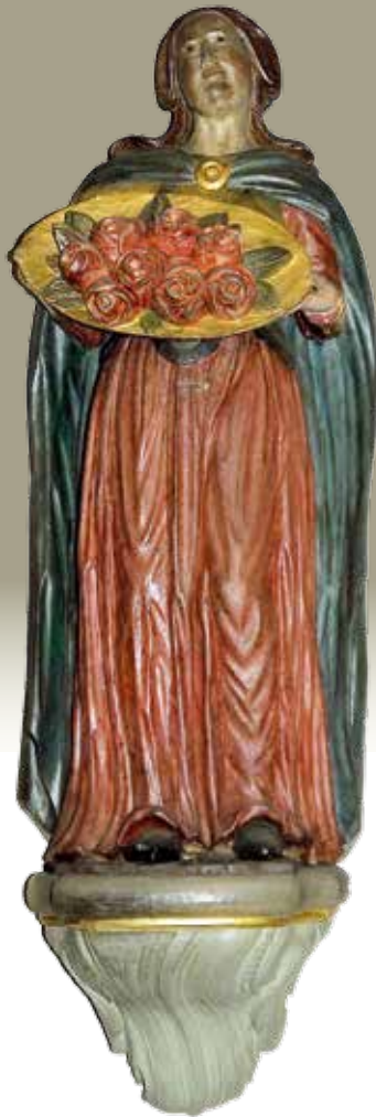
Elisabeth-Statue in St. Peter und Paul Eslohe