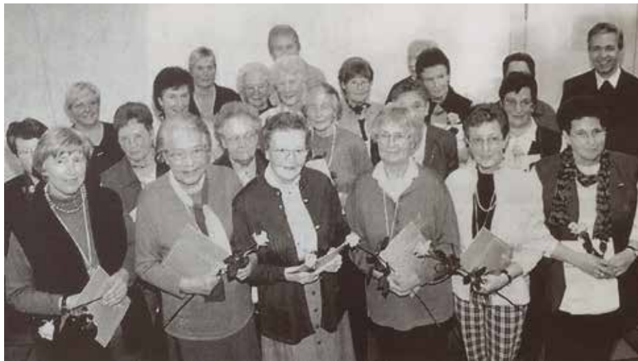
Zahlreiche Mitarbeiterinnen der Caritas Eslohe sind für ihr langjähriges ehrenamtliches Engagement ausgezeichnet worden.

Sie erhielten die Caritas- Ehrennadel in Silber und eine Urkunde aus den Händen der Dekanatsvorsitzenden. „Orden, Nadeln und Urkunden sollen ermutigen, weiterhin tätig zu sein“, so Pfarrer Brieden. Er dankte für den Einsatz der vielen Frauen und stellte die Hl. Elisabeth als Vorbild heraus für Nächstenliebe und Hilfsbereitschaft. (69)