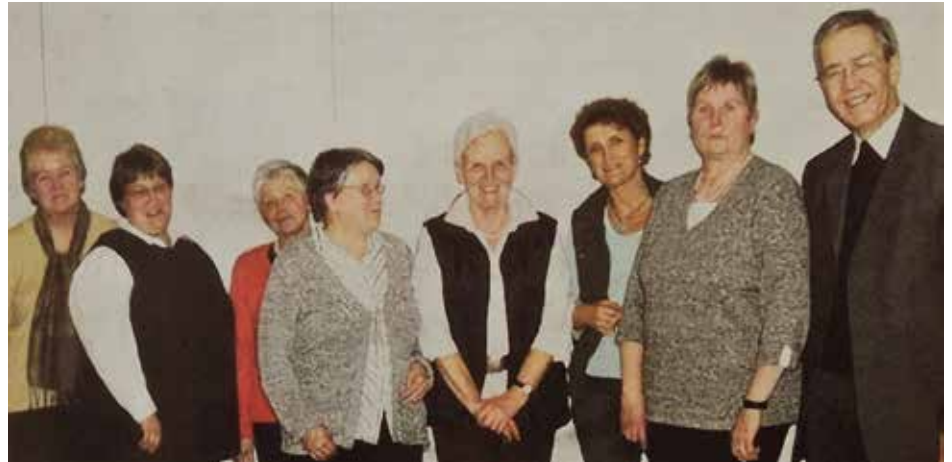
Im Februar 2009 ergaben sich Änderungen im Vorstand. Die Mitglieder stellen sich dem Fotografen.

Die Satzung der Caritas-Konferenzen Deutschland e.V. wurde am 11.5.1971 beschlossen. Der Diözesanrat der Konferenzen im Erzbistum Paderborn änderte bzw. ergänzte diese im Oktober 2003. Die Konsequenz daraus war vorerst wenigen bewusst und wurden deshalb erst später in den Caritas-Konferenzen diskutiert. Im Esloher Pfarrsaal trafen sich am 7.10.2004 die Caritas-Vorsitzenden des Pastoralverbundes „Esloher Land“ und ließen sich zum Thema von der Dekanatsvorsitzenden Gisela Haupt aus Meschede informieren. Bereits eine Woche später traf sich der Vorstand der Caritas-Konferenz Eslohe und beriet über die Umsetzung der Satzungsänderung und ihre Folgen für die Arbeit des Vorstandes. In der nächsten Generalversammlung am 17.2.2005, die mit dem Helferinnenkaffee verbunden war, sollte über die Änderungen in der Satzung abgestimmt werden. Wesentliche Änderungen waren: Der Vorstand wird alle vier Jahre neu gewählt. Die Wiederwahl der Vorstandsmitglieder ist grundsätzlich möglich. Einschränkung: Die Vorsitzende darf nur zweimal wiedergewählt werden. Der Pfarrer (Präses) hat kein Stimmrecht im Vorstand , nur eine beratende Funktion. (70)