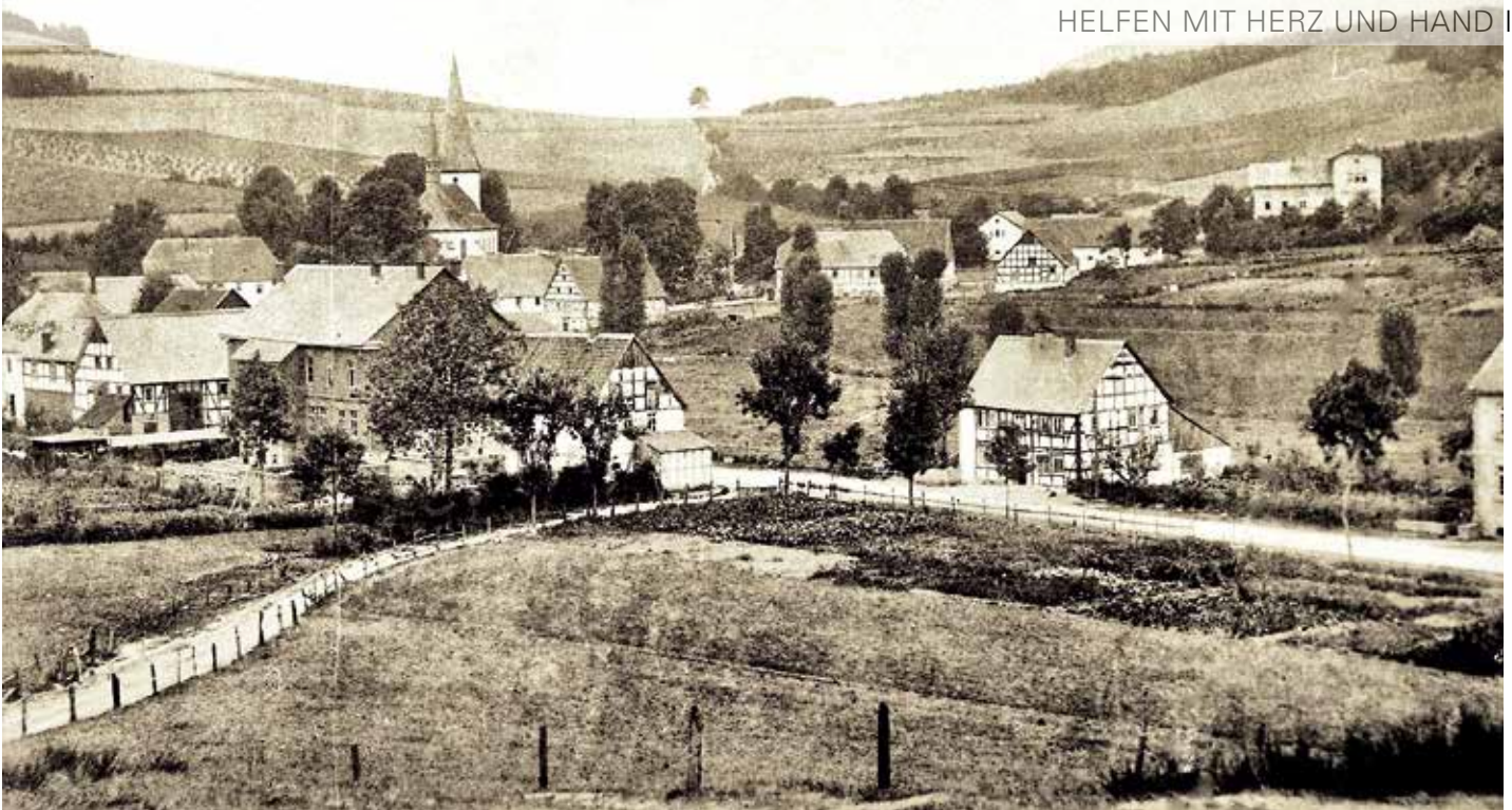
Eslohe um 1885

Im Ort gründete sich nach Kriegsende 1870/71 noch ein weiterer Verein, dessen Mitglieder ausnahmslos Männer waren: Der Kriegerverein. Darunter befanden sich auch hoch geehrte und angesehene Kriegsveteranen, die den Frankreich-Feldzug überlebt hatten. Dieser Verein verfolgte nach den Vereinsstatuten einen anderen, eigenbestimmten Zweck: „Mitgliedern des Vereins, welche der Hülfe bedürftig werden sollten und deren würdig sind, nach Kräften zu unterstützen“. Hier, wie überall im Deutschen Reich, erstarkten diese sog. patriotischen Vereine, deren Fundament der vaterländische Stolz über den Sieg und eine zuvor kaum gekannte Euphorie war. Dennoch sahen die Gründerväter in ihrem Bemühen eine karitative Betätigung.