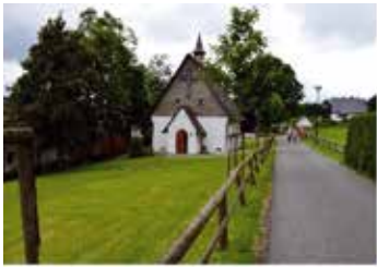
Gottesdienst in St. Bonifatius Schanze Innenansicht

Seniorenfahrt in unserem Pastoralverbund 30. Juni 2016 mit Stationen in Dorlar, Bad Fredeburg, Schanze, Gleidorf