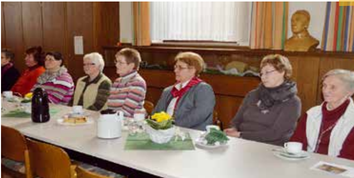
In gespannter Erwartung