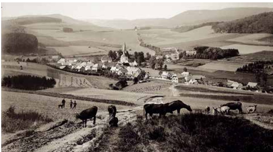
Eslohe um 1900