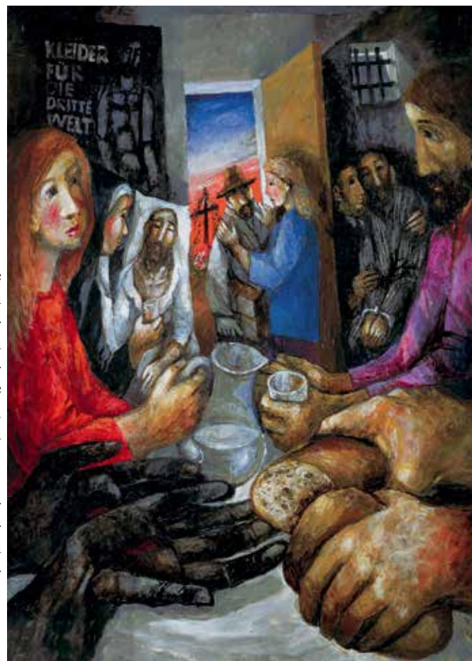
Sieger Köder, Ihr habt mir zu essen gegeben

Der Maler und Priester Sieger Köder (1925 – 2015) hat die Werke der Barmherzigkeit in einem eindrucksvollen Gemälde gestaltet. Die rot gekleidete Frau im Vordergrund reicht einem Durstigen Wasser, wobei sich ihr Blick auch auf die Person richtet, deren Hände Brot brechen: Auf Christus, der das Brot teilt mit einem dunkelhäutigen Menschen, dessen Hände wiederum Wundmale aufweisen, die auf das Leiden Christi verweisen. In der Begegnung mit dem hilfsbedürftigen verwundeten Menschen begegnen wir Christus.