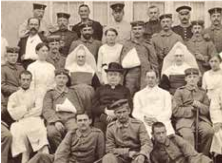
Caritas-Gründer Lorenz Werthmann (Bildmitte mit Buch in der Hand) bei einem Besuch in einem Lazarett 1914.

Katholische Sozialpolitiker, die seit der Mitte des 19. Jahrhunderts einen katholisch-caritativen Zentralverband forderten, fanden im jungen Priester Lorenz Werthmann die dynamische Persönlichkeit zur Realisierung dieses Zieles. Mit dem im Frühjahr 1895 in Freiburg gebildeten „Caritas-Comité“ bereitete Werthmann die Gründung des „Caritasverbandes für das katholische Deutschland“ vor, die er am 9. November 1897 in Köln vollzog. Der neue Verband engagierte sich bald auf vielen Gebieten sozialer Not: Für Saisonarbeiter, Seeleute, „Tippelbrüder“, Trinker, körperlich und geistig behinderte Menschen, von Geschlechtskrankheiten Betroffene setzte er sich ebenso ein wie für Kindergärten, Fürsorgeerziehung, Mädchenschutz, Krankenpflege und Frauenfragen.