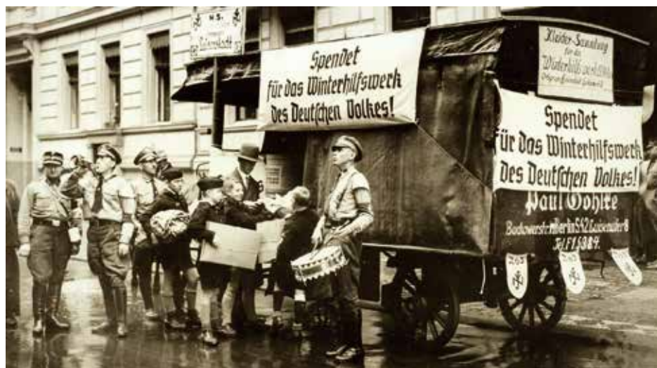
Sammelwagen für Kleider- und Lebensmittelspenden, Foto um 1934

In der Folge trat das Komitee mehrfach zusammen, wie es die sorgsam verfassten Protokolle des Vorsitzenden beweisen. Ein Hinweis auf Aktivitäten einzelner Eslohe Vereine, wie z.B. den Elisabethenverein, fehlt. Offensichtlich strebte man eine übergeordnete Organisation der erforderlichen Maßnahmen und der damit notwendigen Zuordnung verschiedener Aufgaben auf spezialisierte Einzelpersonen für Krankenpflege, Küche, Wäsche und Lebensmittel an. Dennoch fällt