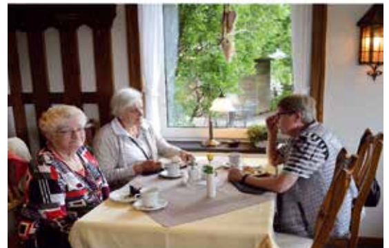
Im Gasthof Bräutigam Hanses, Schanze